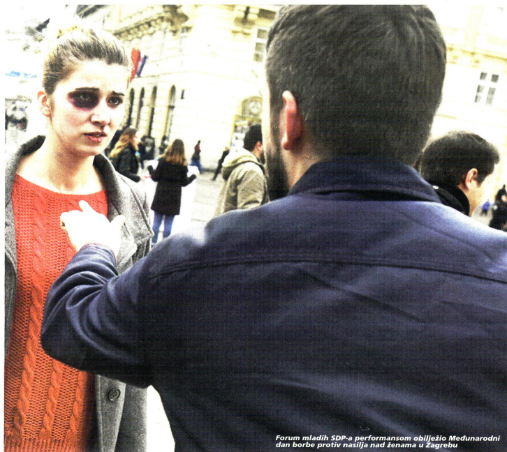
Forum mladih SDP-a performansom obilježilo Međunarodni dan borbe protiv nasilja nad ženama u Zagrebu

Jelačića kojim su upozorili na porast obiteljskog nasilja u Hrvatskoj. Još jednom pozvali su Vladu da ratificira Istanbulsku konvenciju Vijeća Europe o sprječavanju i borbi protiv nasilja nad ženama i nasilja u obitelji.